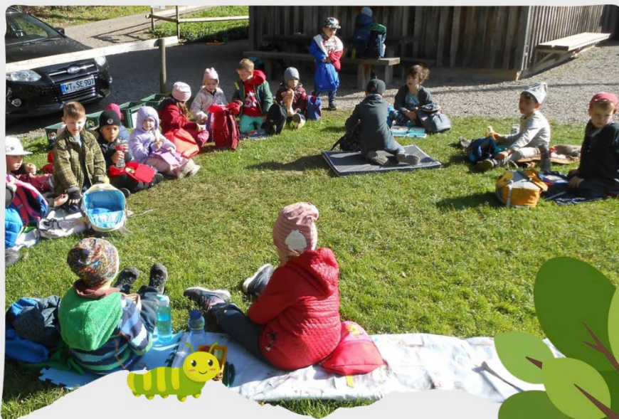
Die Kinder und das Team des Kindergarten Tausendfüßler Schwerzen

Es war eine gelungene Waldwoche und wir freuen uns schon auf die nächsten Waldtage.