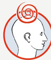
Schwindel mit Gangunsicherheit