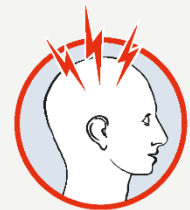
Sehr starker Kopfschmerz

Helfen Sie uns, Leben zu retten und Behinderungen zu vermeiden. Mit Ihrer Spende.