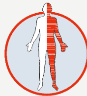
Lähmung, Taub- heitsgefühl